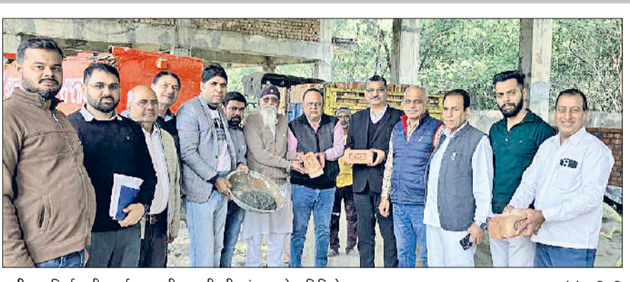
पानीपत। निर्माणाधीन धर्मशाला की सामग्री की जांच करते समिति के सदस्य।