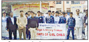
पानीपत। आर्य वरिष्ठ माध्यमिक विद्यालय से जागरूकता रैली निकालते विद्यार्थी।