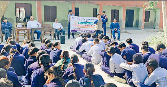
इंद्री। राजकीय वरिष्ठ माध्यमिक विद्यालय बीबीपुर जाटान में बुधवार को बच्चों को जानकारी देते आयोजक।