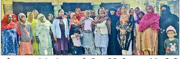
पानीपत। ज्ञापन सौंपने जाते हुए जनवादी महिला समिति की सदस्य।

अंतरराष्ट्रीय मानवाधिकार दिवस के अवसर पर माइक्रोफाइनेंस कंपनियों की लूट के खिलाफ और महिलाओं के कर्जों माफ करने की मांग को लेकर उपायुक्त कार्यालय पर जनवादी महिला समिति द्वारा ज्ञापन दिया गया।