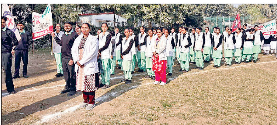
अंबाला। खेल उत्सव से पहले मार्च पास्ट करती छात्राएं।