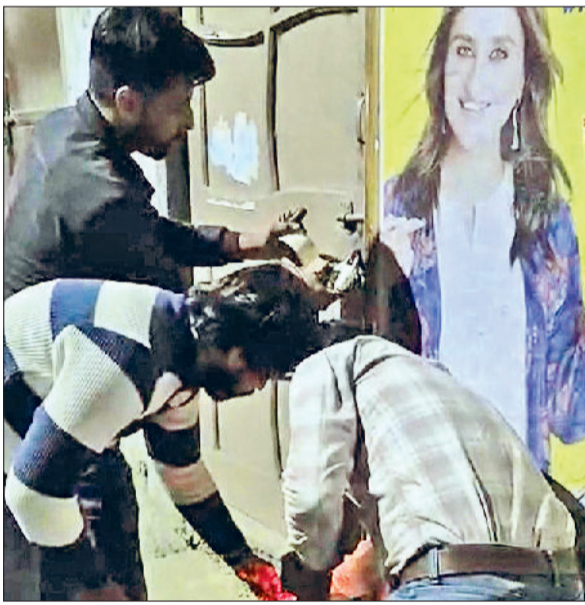
यमुनानगर। संपत्ति कर जमा न करवाने पर पेट्रोल पंप को सील करती निगम की टीम।