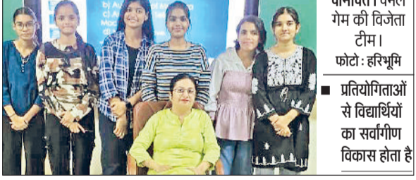
पानीपत। पैनल गेम की विजेता टीम।