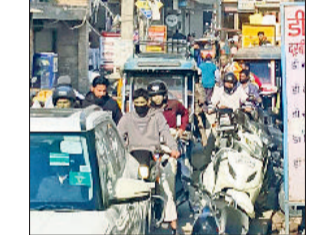
खन्ना रोड पर लगे जाम का दृश्य।

किशनपुरा के खन्ना रोड पर सड़क पूरी नहीं बनाए जाने के कारण लोगों को भारी परेशानी का सामना करना पड़ रहा है। क्षेत्र वासियों ने नगर निगम अधिकारियों से मांग की है कि जल्द से जल्द इस समस्या का समाधान कराया जाए। किशनपुरा निवासियों