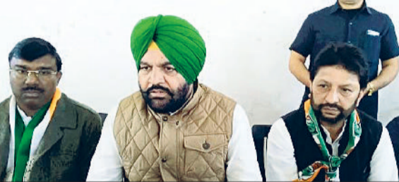
करनाल। पत्रकारों से बातचीत करते हुए सांसद गुरजीत औजला।

कांग्रेस पार्टी द्वारा वोट चोर गद्दी छोड़ अभियान को लेकर पूरे देश में माहौल बनाया जा रहा है। इस अभियान को लेकर एक बड़ी शक्ति प्रदर्शन रैली 14 दिसंबर को दिल्ली के रामलीला मैदान में होने जा रही है। रैली की तैयारियों को मजबूती देने और संगठन को सक्रिय करने के उद्देश्य से कांग्रेस ने अलग-अलग जिलों में ऑब्जर्वर नियुक्त किए हैं। इसी क्रम में करनाल स्थित मानव सेवा संघ में