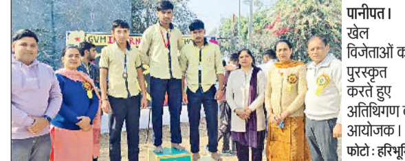
पानीपत। खेल विजेताओं को पुरस्कृत करते हुए अतिथिगण व आयोजक।