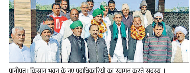
पानीपत। किसान भवन के नए पदाधिकारियों का स्वागत करते सदस्य।